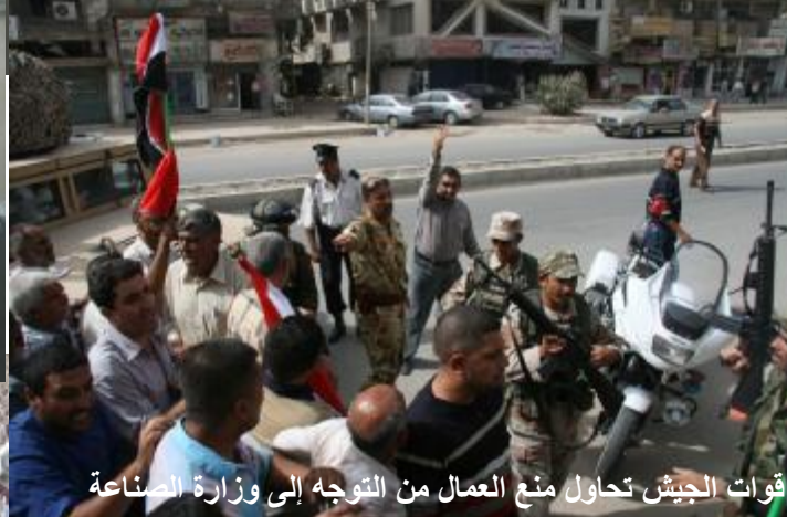
قوات الجيش تحاول منع العمال من التوجه إلى وزارة الصناعة