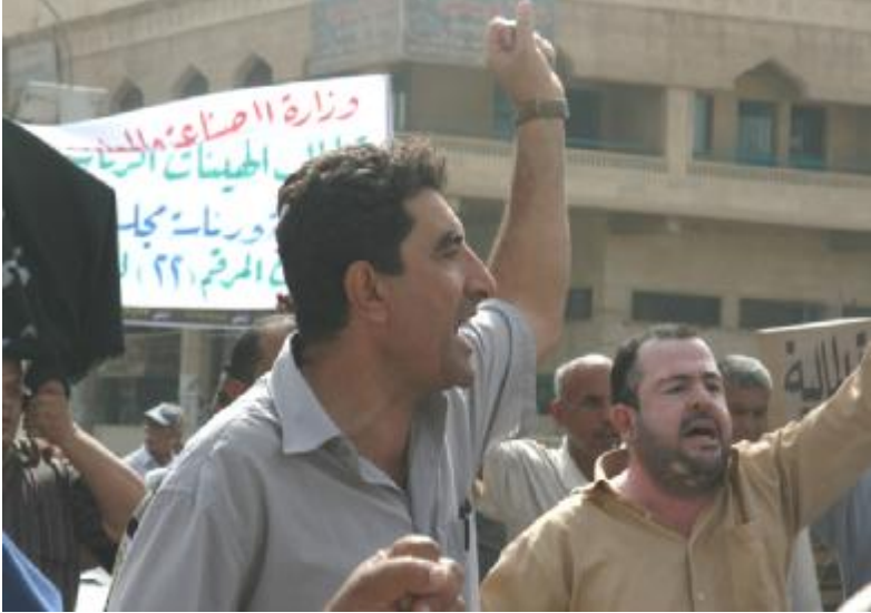
نص البيان الذي أصدره اتحاد المجالس والنقابات العمالية في العراق والذي دعا فيه إلى الاعتصام والتظاهر ضد قرارات وزارة المالية المعادية للعمال

نحو موجة جديدة من الاعتصامات والإضرابات بعد موجة الاعتصامات والتظاهرات التي نظمها العاملون في القطاع الصناعي أواخر آب - أغسطس الماضي، وبعد المفاوضات والاجتماعات التي عقدت مع المسؤولين في وزارة المالية ووزارة الصناعة أعلن المسؤولون عن استعداد وزارة الصناعة لتنفيذ مطالب العاملين. لقد نكثت وزارة الصناعة ووزارة العاملين في القطاع الصناعي، وبعد أغسطس الماضي، وبعد المفاوضات والاجتماعات التي عقدت مع المسؤولين في وزارة المالية ووزارة الصناعة، أعلن