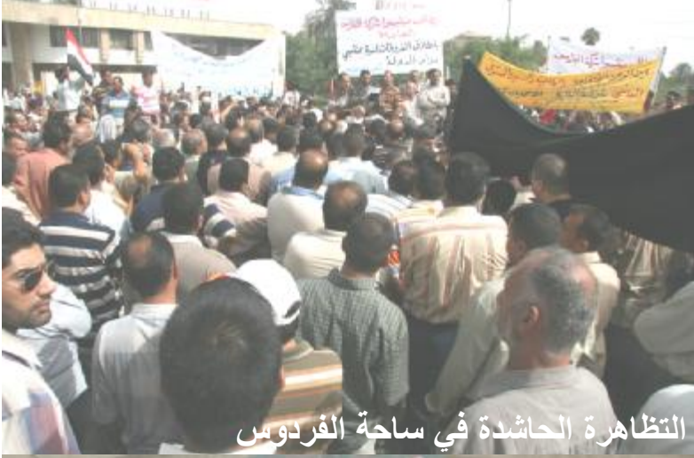
التظاهرة الحاشدة في ساحة الفردوس