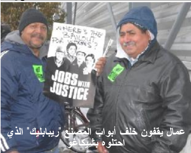
عمال يقفون خلف أبواب المصنع "ريبابليك" الذي احتلوه بشيكاغو

شيكاغو، الولايات المتحدة (CNN) مفتوحاً في المصنع حتى حل -- يعتصم عدد من العمال الأمريكيين في مصنع بمدينة ماكلين: "نحن هنا منذ الليلة شيكاغو منذ الجمعة، رافضين الماضية (الجمعة) ولن نذهب إلى مغادرته، بعد أن تلقوا إشعاراً أي مكان.. نحن مصممون على بالطرده خلال ثلاثة أيام، بحجة أن ذلك." ووصف العمال، الذين المصنع سيفقل بسبب الأزمة الاقتصادية العالمية وحالة الركود التي يعيشها الاقتصاد الأمريكي، الأبواب والنوافذ هو "احتلال وقد تبادت مجموعات أخرى من العمال لتقديم الدعم لهم. وقال في المنشأة، مع تبديل النوبات العمال إنهم سينفذون اعتصاماً وفق السدوم