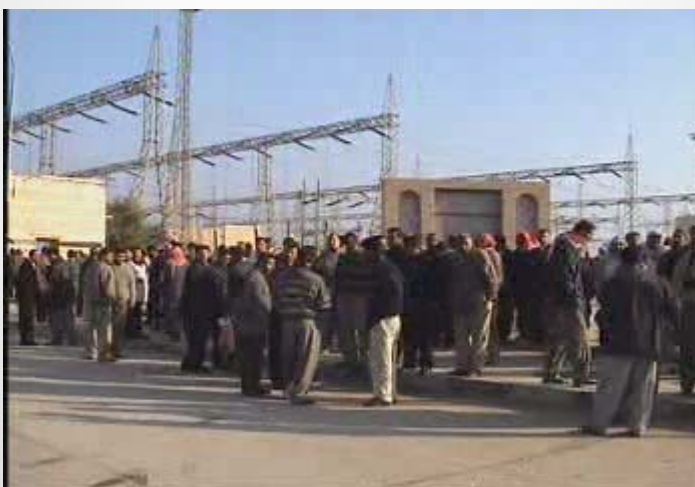
من الأرشيف: صورة تظهر جانباً من الإضراب الشهير لعمال الطاقة في الناصرية الذي فرض فيه العمال مطالبهم

ببديل عدوى او بدل خطورة او حتى ان يكون من حقهم اخذ إجازة مدفوعة الأجر حتى وان كان ذلك بسبب تعرضهم لأي مرض نتيجة ظروف عملهم القاسية وليس هذا