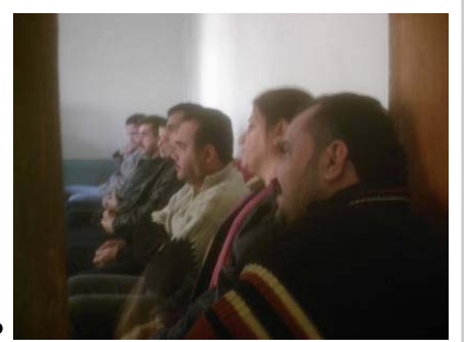
عبيد، فلاح علوان. تناول الاجتماع المسائل

ونتيجة مطالبنا المتكررة بهذا الخصوص فقد أمر أمين بغداد